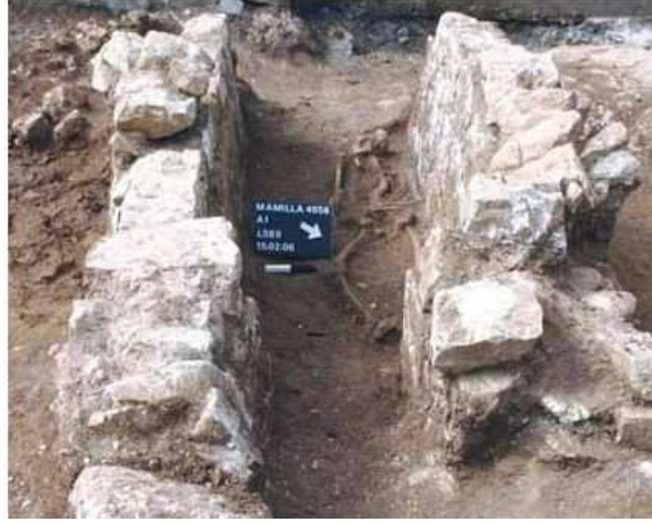
صورة رقم ٣: نبش أحد قبور المسلمين في مقبرة مأمن الله

تصرفاتها فننّها تسعى لتحقيق السيطرة اليهودية على الأحياء العربية في القدس غير ابهة بالأثار الإسلامية في المكان مزيلة أياها تحت مسميات البحث العلمي (٢١) .